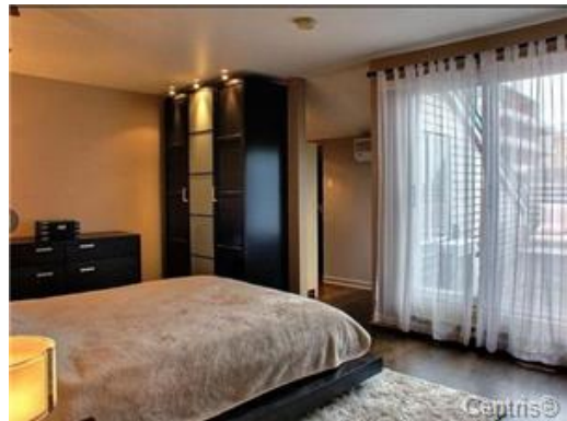
Chambre à coucher principale