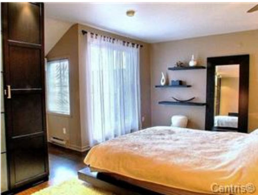
Chambre à coucher principale